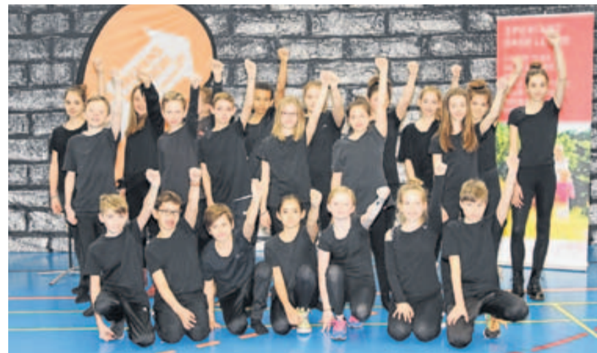
Die Tanzgruppe «No Limits» der Primarschule Biel-Benken tanzte sich aufs oberste Podest. Wir gratulieren herzlichst!